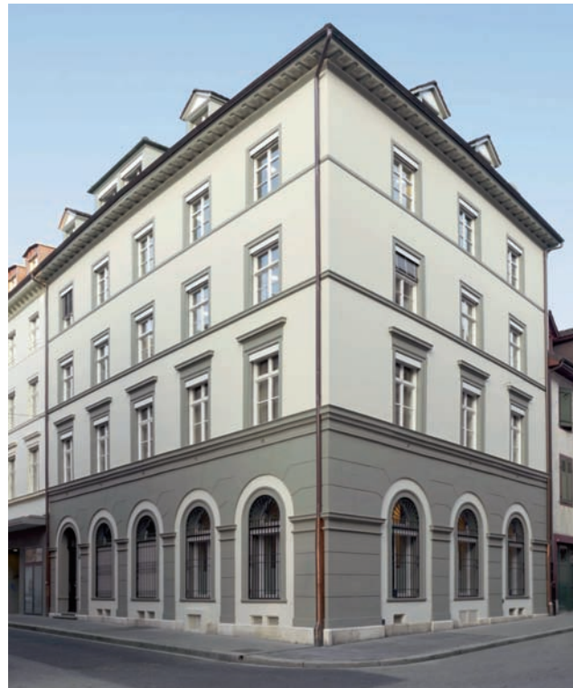
Immeuble abritant la Banque Gutzwiller, à la Kaufhausgasse 7, à Bâle.

À Lausanne , c'est l'arrivée de la deuxième vague d'immigrés huguenots vers la fin du XVII e siècle suite à la révocation de l'édit de Nantes qui marquera l'économie de la ville et, au-delà, du canton de Vaud tout entier. Ils sont 1 500 à venir se réfugier dans le chef-lieu vaudois en 1693. « Par le contact maintenu avec leurs compatriotes en exil et ceux des leurs demeurés en France, ils rouvrirent à leur terre d'accueil des perspectives insoupçonnées dans le domaine des transactions commerciales et financières. » 7 C'est alors qu'est née la plus ancienne banque privée de