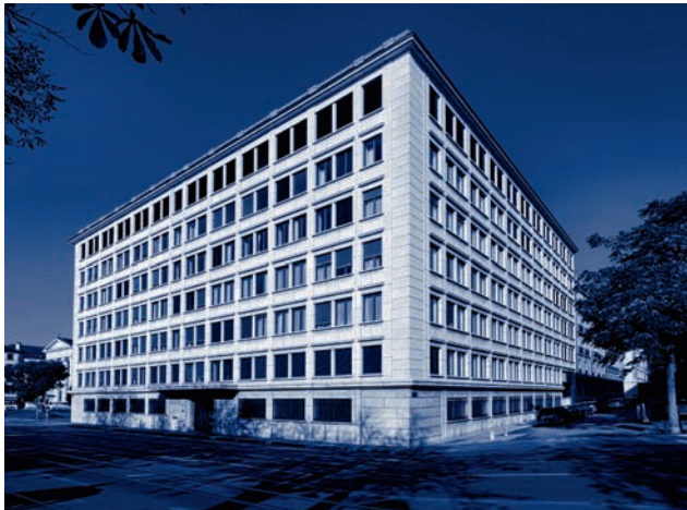
Façade de la Banque Mirabaud au Boulevard Georges-Favon 29, à Genève.

À Lausanne , c'est l'arrivée de la deuxième vague d'immigrés huguenots vers la fin du XVII e siècle suite à la révocation de l'édit de Nantes qui marquera l'économie de la ville et, au-delà, du canton de Vaud tout entier. Ils sont 1 500 à venir se réfugier dans le chef-lieu vaudois en 1693. « Par le contact maintenu avec leurs compatriotes en exil et ceux des leurs demeurés en France, ils rouvrirent à leur terre d'accueil des perspectives insoupçonnées dans le domaine des transactions commerciales et financières. » 7 C'est alors qu'est née la plus ancienne banque privée de