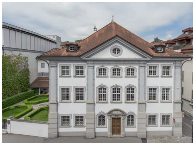
Immeuble abritant la Banque Reichmuth à la Rütligasse 1, à Lucerne.

Zurich , quant à elle, voit des banquiers privés se développer depuis le xviii e siècle, et particulièrement en lien avec l'industrie du textile. À l'exemple de Rahn+Bodmer Co. , qui est d'abord un commerce de soierie, créé en 1750, et qui ne se consacrera exclusivement aux affaires de banque qu'à partir de 1855 11 . Tandis que Lucerne n'a pas connu de véritable banque avant l'ère industrielle. Le banquier privé Reichmuth & Co , par exemple, y est apparu en 1996 et est le dernier-né des banquiers privés suisses 12 .