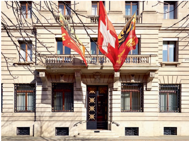
Façade de la Banque Lombard Odier à la rue de la Corraterie 11, à Genève.

étaient particulièrement appréciés par la haute société internationale pour leur fiabilité, leur discrétion et leur stabilité dans les affaires.